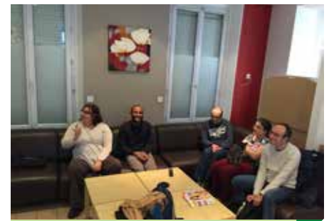
Salon des résidents

Il y aura 30 places pour le foyer d'hébergement, réparties sur deux étages où l'on trouvera des studios d'une personne ou pour des couples. Le foyer de vie comprendra 15 internes, 13 externes, soit sept places supplémentaires. « Cette cohabitation entre les deux foyers garantira une nouvelle dynamique et une synergie qui devrait optimiser la fluidité des accompagnements », remarque la directrice. Cette résidence présentera de nombreux avantages dont une excellente localisation en centre-ville, près des petits commerces, de la gare qui favorisera l'insertion dans la ville d'Hardricourt, l'une des communes du Syndicat intercommunal.